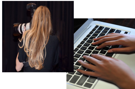
商品画像・商品データの登録・管理